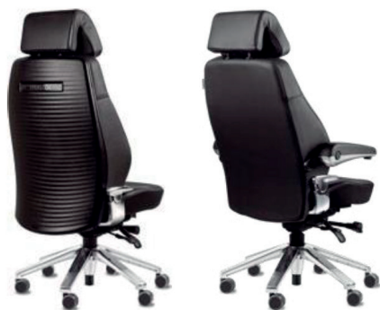
S5 avec coque de protection du dossier